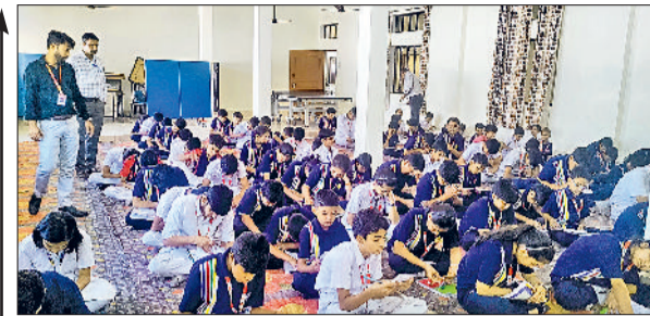
बवानीखेड़ा। पुलिस सुरक्षा नियम की परीक्षा देते हुए।

आज की भागदौड़ भरी जिंदगी में जिस प्रकार हम अपने स्वास्थ्य के प्रति लापरवाही बरत रहे हैं, उसी को ध्यान में रखते हुए लोगों में जागरूकता फैलाने के लिए इस शिविर का आयोजन किया गया है। स्वास्थ्य के बिना सभी सुविधाएं महत्वहीन हैं। जो व्यक्ति तन और मन से स्वस्थ होता है, वह संसार का सबसे सुखी प्राणी है, क्योंकि स्वस्थ तन में ही स्वस्थ मन का वास होता है। यह बात वैश्य