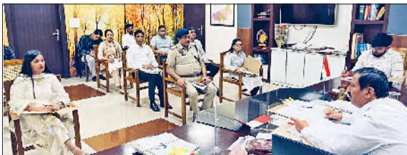
चरखी दादरी। अवैध माइनिंग और ओवरलोड को लेकर अधिकारियों की मीटिंग लेते उपायुक्त।

उपायुक्त डॉ. मुनीश नागपाल ने कहा है कि जिला में अवैध माइनिंग और ओवरलोड पर सिरों से लगाम लगाएं। इसको लेकर कोताही किसी भी हाल में सहन नहीं की जाएगी। संबंधित विभागों की संयुक्त टीम लगातार चेकिंग करे। उपायुक्त बुधवार को अपने कार्यालय में माइनिंग को लेकर संबंधित अधिकारियों की बैठक ले रहे थे। उन्होंने संबंधित विभागों के अधिकारियों द्वारा की गई चेकिंग की समीक्षा की और कहा कि खनन अधिकारी चेकिंग को लेकर प्रमाण पत्र देंगे कि उन्होंने किस किस स्थान पर निरीक्षण किया और उसमें फोटो आदि