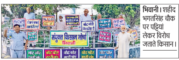
भिवानी। शहीद भगतसिंह चौक पर पहियां लेकर विरोध जताते किसान।