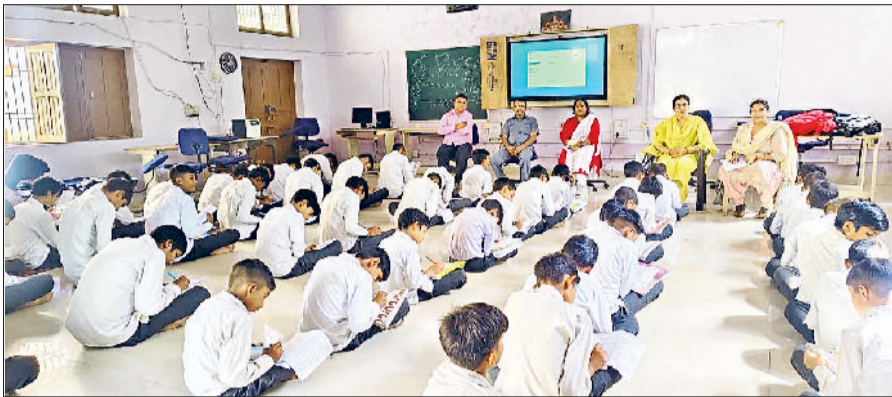
बवानीखेड़ा। सड़क सुरक्षा नियमों के तहत परीक्षा देते हुए विद्यार्थिगण।