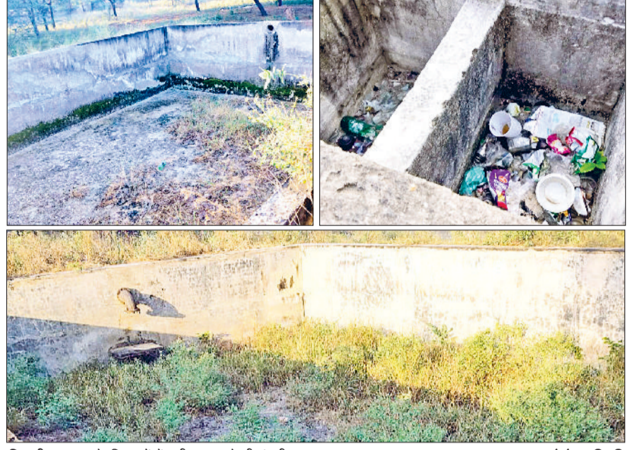
भिवानी। जलघर के फिल्टरों में उगी घास व फैली गंदगी।