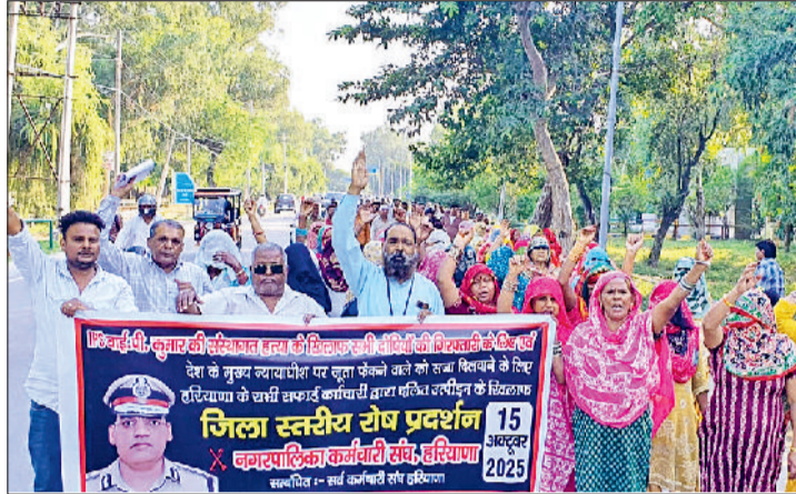
भिवानी। कार्रवाई की मांग को लेकर शहर में जुलूस निकालते हुए व किसी अप्रिय घटना से बचने के लिए सचिवालय के बाहर तैनात पुलिस बल।