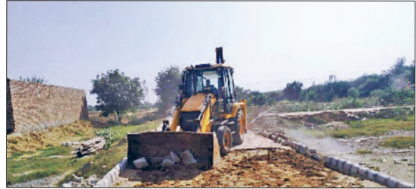
भिवानी। अवैध निर्माण ढहाती जेसीबी।

लोगों से अपील: सरकारी जमीन पर कहीं भी व अनाधिकृत कॉलोनी में अवैध निर्माण न करें