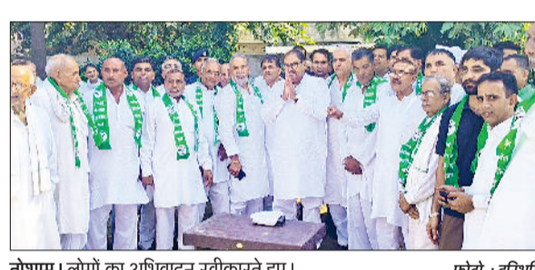
तोशाम। लोगों का अभिवादन स्वीकारते हुए।