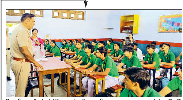
भिवानी। छात्रों को संबोधित करते पुलिस अधीक्षक।