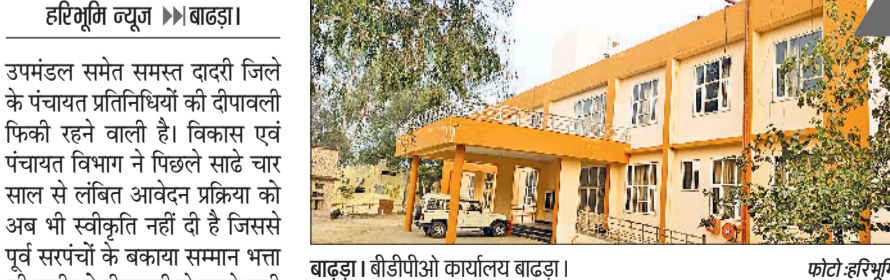
बाढ़ड़ा। बीडीपीओ कार्यालय बाढ़ड़ा।

उपमंडल समेत समस्त दादरी जिले के पंचायत प्रतिनिधियों की दीपावली फिकी रहने वाली है। विकास एवं पंचायत विभाग ने पिछले साढ़े चार साल से लंबित आवेदन प्रक्रिया को अब भी स्वीकृति नहीं दी है जिससे पूर्व सरपंचों के बकाया सम्मान भत्ता की राशि को दीपावली से पहले जारी होने पर सवालिया निशान लग गया है। विभाग ने वर्ष 2016 से वर्ष 2021 तक कार्यकाल वाले सरपंचों के अलग अलग मार्च माह में आनलाईन तरीके से आवेदन करवाया था, लेकिन पिछले 52 माह से सम्मान भत्ता आवेदन करने के लिए पोर्टल ओपन