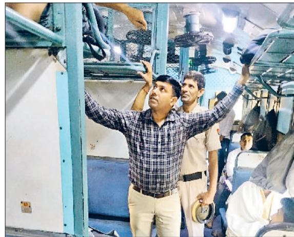
भिवानी। रेलगाड़ी में चेकिंग करती पुलिस।